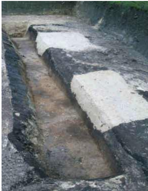
Zwei der mit hellem Sand gefüllten Fundamentgruben im Schnitt.