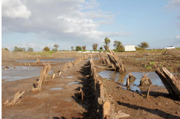
Abb.: Widdelswehr (14). Die durch Baggerarbeiten freigelegte Holzkonstruktion des Stackdeiches, Blick vom Nordwestende nach Süden.

Veröffentlicht im Emdener Jahrbuch, Band 93, 2013