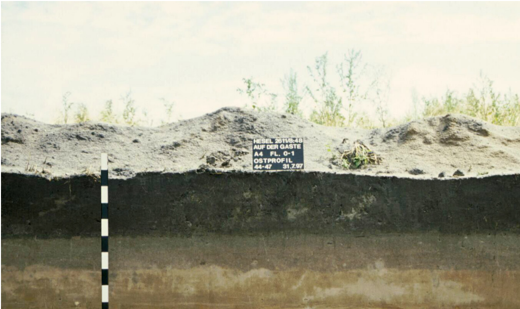
Abb. 1: Hesel. Profilschnitt mit eisenzeitlichem Sandüberwehungshorizont unter mittelalterlichem Plaggengesch.