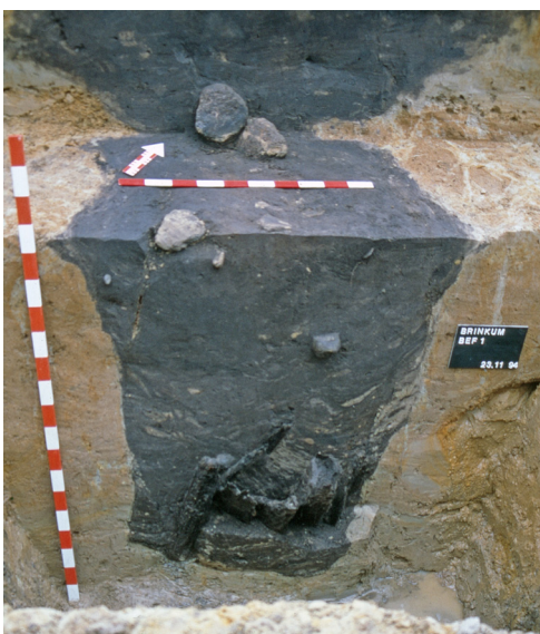
Abb. 1: Holtland. Wasserschöpfstelle ohne Sodenschacht.