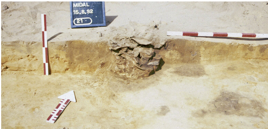
Abb. 1: Holtland. Siedlungsgrube mit Keramikscherben der älteren Eisenzeit.