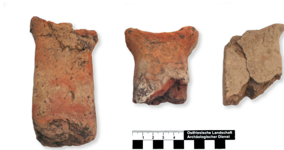
Abb. 2: Burhufe. Bruchstücke von Feuerböcken aus einer Siedlungsgrube der Vorrömischen Eisenzeit.

halb der Riegel halten die Pfosten einen Abstand von rund 1,8 m ein, während sie selbst im Abstand von etwa 2,3 m stehen. Der Konstruktion nach scheint es sich um einen mittelalterlichen Speicherbau zu handeln. Eine lange, grabenparallele Pfostenreihe (P 2) besteht aus mindestens acht im Abstand von 2 und 3 m aufgestellten Pfosten. Eine gleichlaufende Pfostenreihe fand sich dazu nicht, möglicherweise hat sie der Graben im Süden zerstört. Östlich davon kam eine Achtpfostensetzung zu Tage (P 3), die eine Breite von 4 m und eine Länge von 8 m aufweist. Eine gleiche Pfostensetzung westlich davon besitzt nur eine Breite von 3 m (P 4). Länge und Breite der beiden Pfostensetzungen erinnern an die frühmittelalterlichen Häuser in Esens, Ldkr. Wittmund, die aus mehreren konstruktiven Teilen bestehen und auch einen dreischiffigen Bauabschnitt aufweisen (BÄRENFÄNGER 2002).