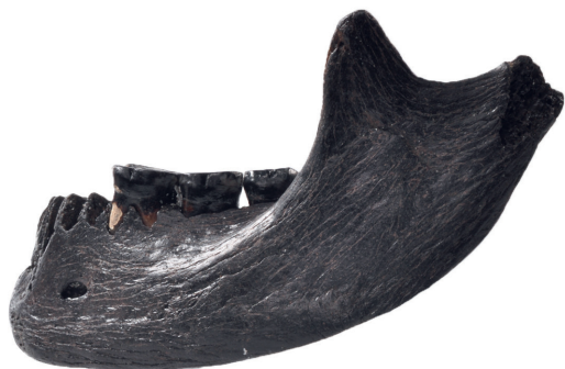
Abb. 1: Baltrum. Neolithischer menschlicher Unterkiefer von der Insel Baltrum.