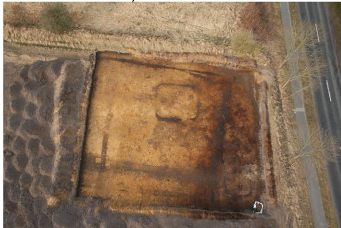
Abb. 2 Esens (19). Die Grabungsfläche im Luftbild