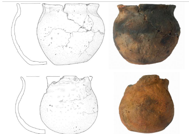
Abb. 3 Esens (13). Eitöpfe aus den Gruben 20 und 21 (Zeichnung: B. Kluczkowski, Foto: G. Kronsweide)