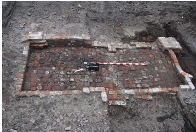
Abb. 4 Esens (20). Frühneuzeitlicher Keller