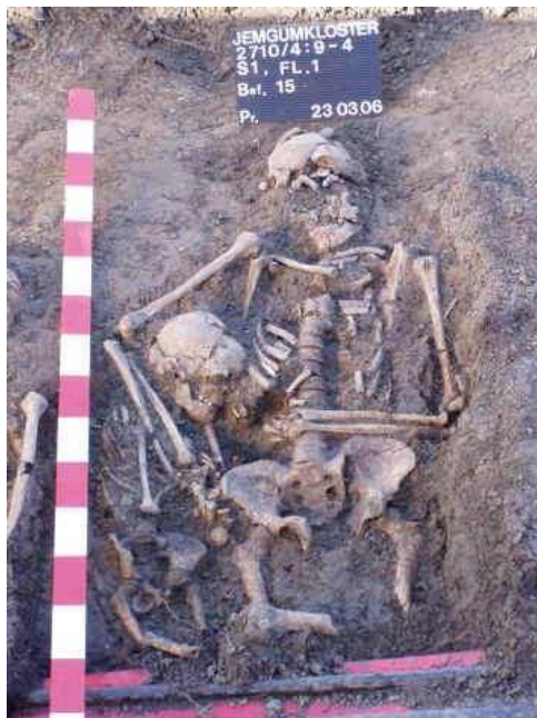
Doppelbestattung eines älteren Mannes und eines Kindes (Foto: A. Prussat).